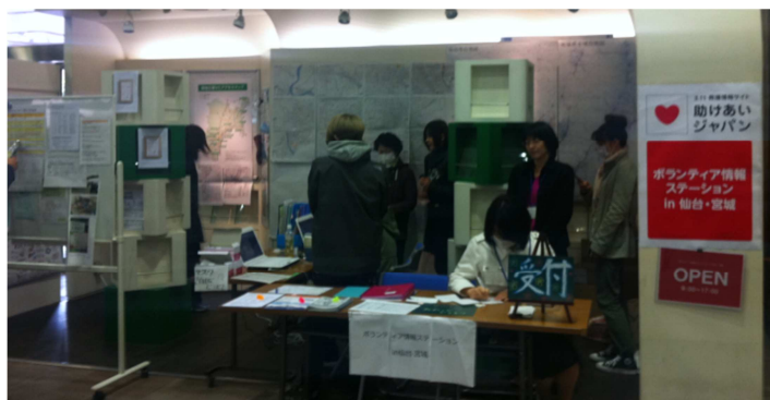
ボランティア情報ステーション in 仙台・宮城の様子