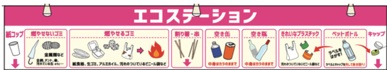
↑エコステーション看板：この種類で分別します